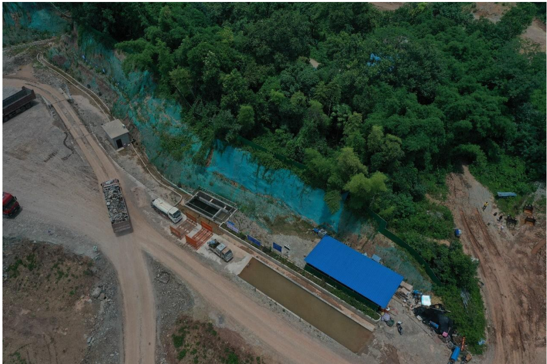
露天采场区排水设施