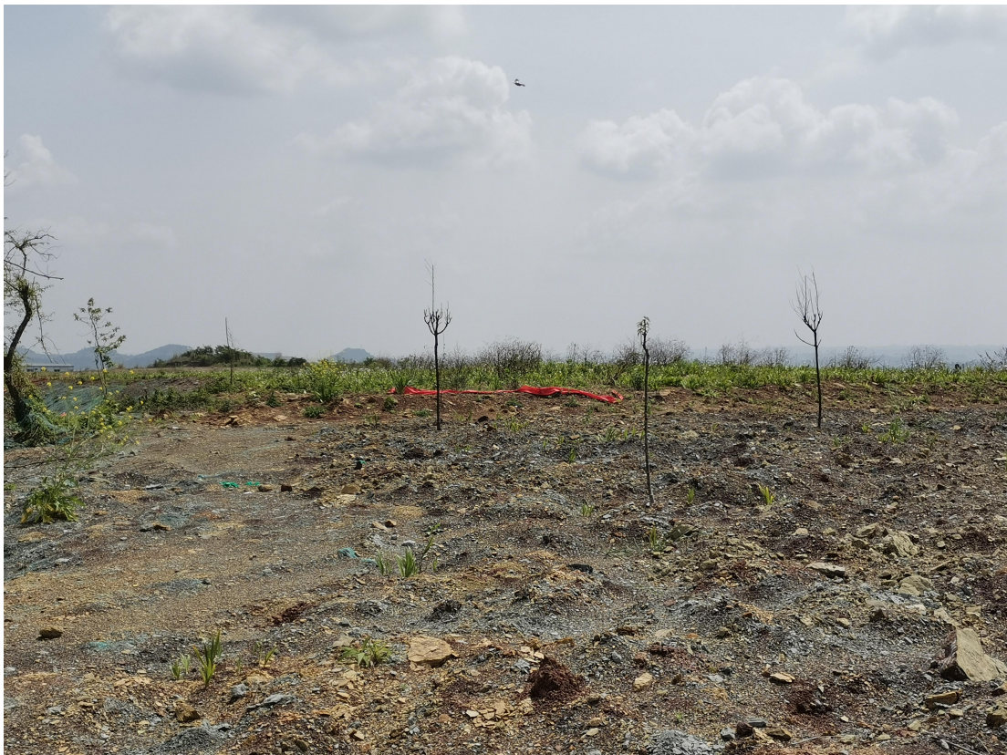
植物措施生长情况