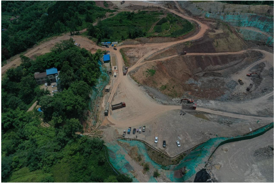
露天采场区周边排水沉沙设施